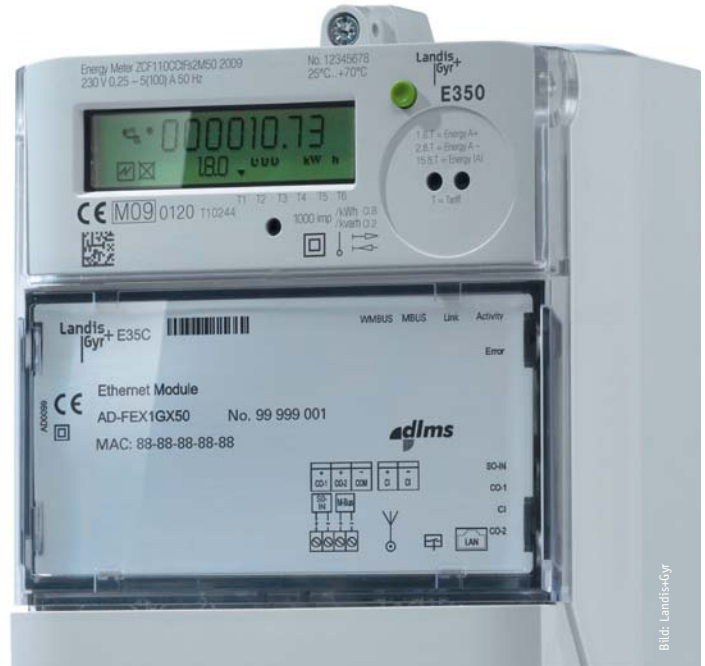
Seit Anfang 2010 schreibt das Energiewirtschaftsgesetz vor, dass Messstellenbetreiber in neu errichteten Gebäuden und bei Grundsanierung Smart Meter einbauen.

Als Webserver diente das Open Source Produkt Tomcat, da hier die Integration mit dem Axis2 Framework vorteilhaft war; Programmiersprache ist Java. Auf der Grundlage dieser Systemumgebung konnten eine Reihe von Prozessen realisiert und integriert werden, darunter der Geräte-