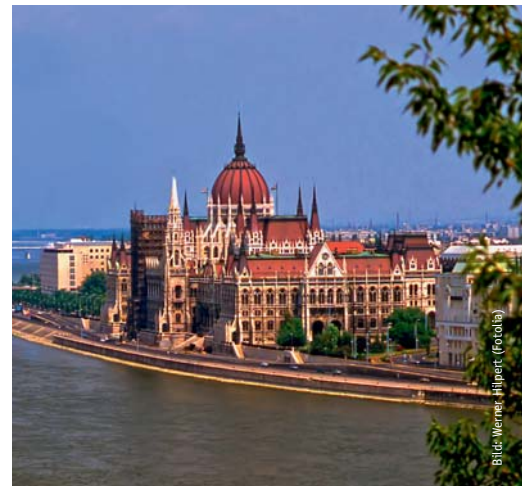
ArcMind unterhält seit 2008 eine Niederlassung im Norden von Budapest und betreut vor Ort u. a. den Kunden ELMÜ Nyrt.

Wichtige Rollen im nationalen Liberalisierungsprozess spielen vor Ort das ungarische Energiebüro (Magyar Energia Hivatal), das für die Regelung und Überwachung des Entflechtungsprozesses verantwortlich ist, sowie die ungarische Energiebörse (HUPX), die ihre Tätigkeit am 20. Juli 2010 aufnahm.